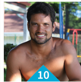
10 MICHEL BOUREZ SURF