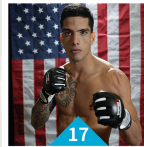
17 RAIHERE DUDES MUAY THAI-MMA