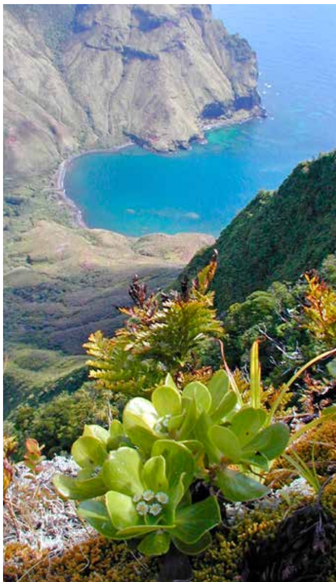
■ Pacifigeron rapensis , une espèce "En danger critique", présente uniquement sur l'île de Rapa dans l'archipel des Australes © Jean-Yves Meyer

Porté par la Direction de l'environnement de Polynésie française, avec le soutien de la Délégation à la recherche, le travail de compilation des informations et de pré-évaluation