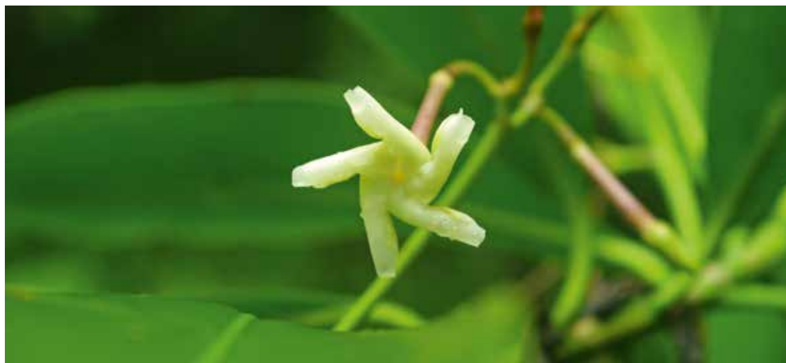
■ L'espèce Lepinia taitensis , endémique des îles de Tahiti et Moorea dans l'archipel de la Société, classée "En danger"

(2) Tendance d'évolution des populations : en augmentation (↗), en diminution (↘), stable (→) ou inconnue (?).