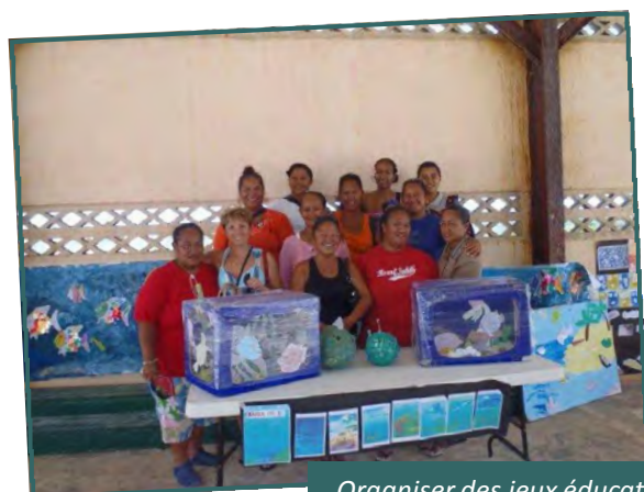
Organiser des jeux éducatifs