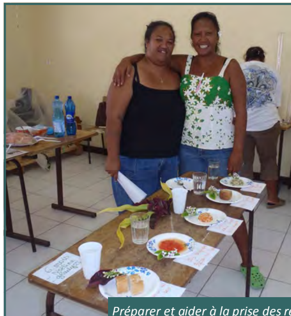
Préparer et aider à la prise des repas

A l'issue de cette formation, chaque stagiaire aura appris à :