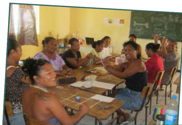
Organiser et participer à des exercices