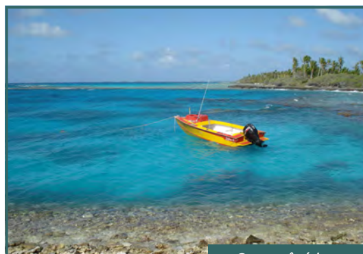
Ovao côté lagon