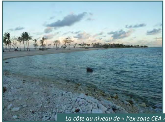
La côte au niveau de « l'ex-zone CEA » sera continue et sans « épi »

Les parcelles de « l'ex-zone CEA » pourront être restituées à leurs propriétaires au cours du 1 er trimestre 2012.