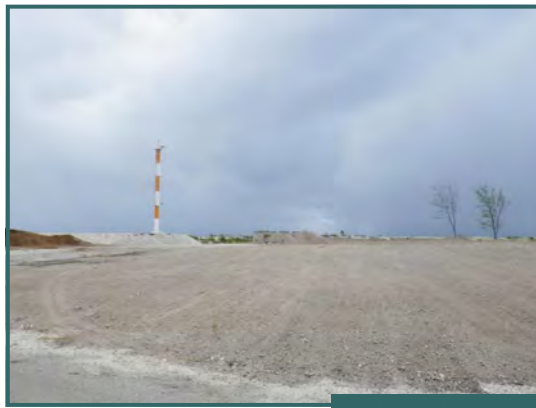
Phare de la passe Kaki