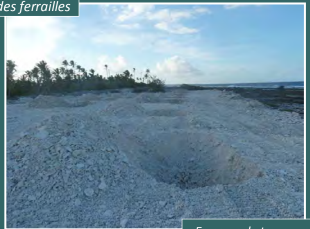
En cours de travaux