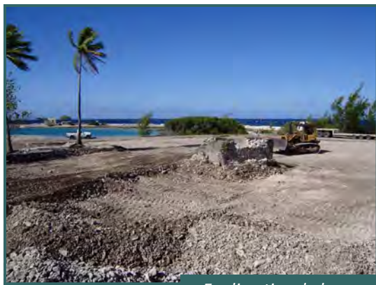
En direction de la passe Kaki

Le mandat REHAB-8 a pu également, en avance de phase, déployer du personnel sur les parcelles AT1 à AT9 afin de procéder à une première expertise visuelle des actions futures à mener. Par le travail effectué par le détachement REHAB-8 et qu'achèvera le mandat REHAB-9, la zone de la passe Kaki devrait pouvoir être restituée en 2012.