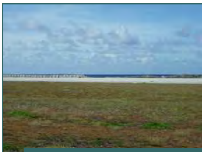
Cordon littoral éventré au sud de la piste aéronautique