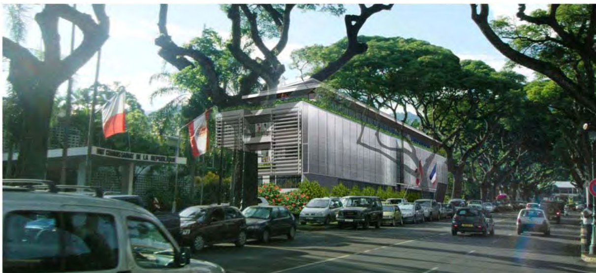
Façade avant – Vue d'ensemble dans l'Avenue Pouvana'a Oopa

Il sera situé avenue Pouvana'a Oopa, à partir du parking du Haut-Commissariat jusqu'à la rue Dumont d'Urville face à la Présidence.