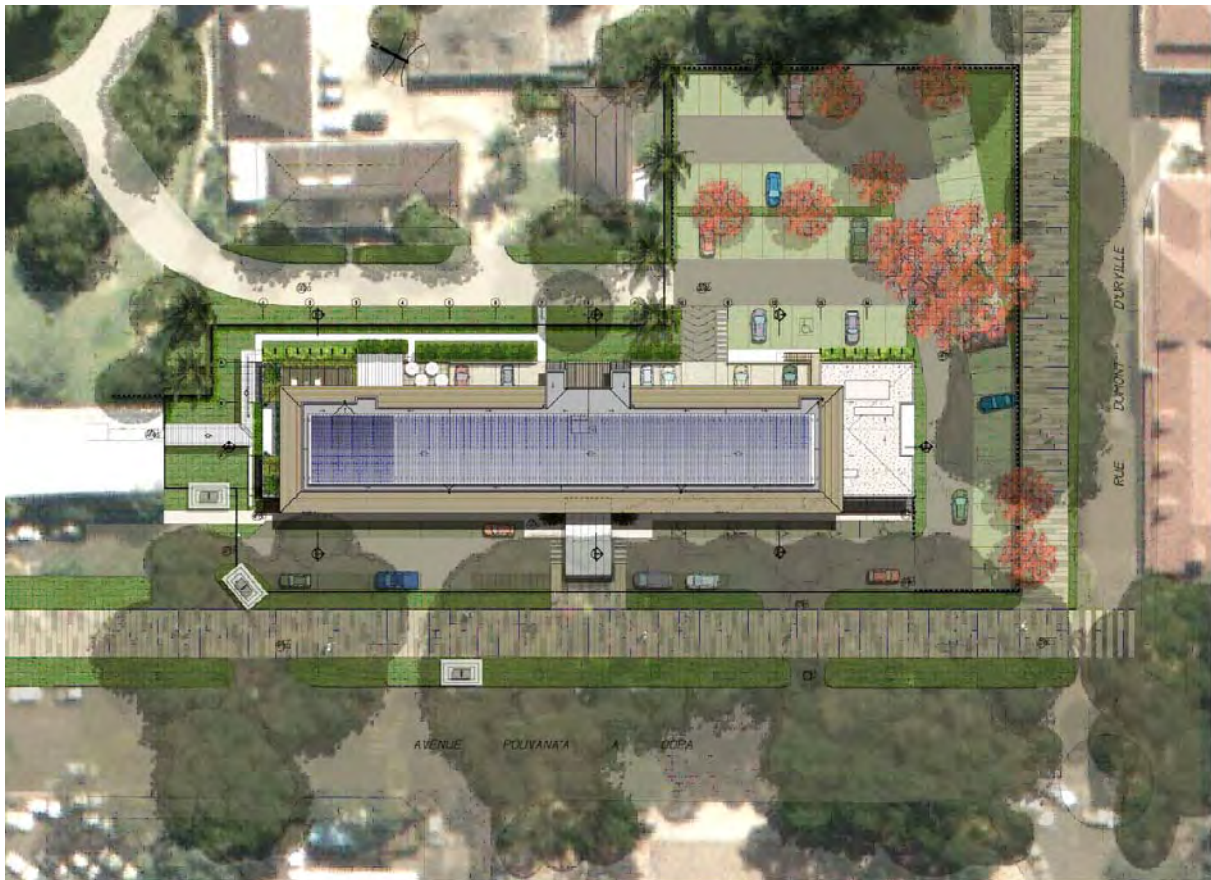
Vue du ciel

Ce projet s'inscrit dans une démarche écologique avec l'installation de panneaux solaires qui fourniront la moitié des besoins électriques du bâtiment.